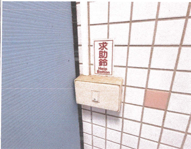
照片 3：一般廁所求助鈴