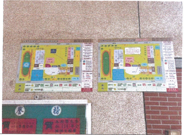
照片 2：防災避難疏散地圖